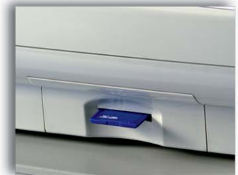
Tarjeta SD Flash con 512 MB (opcional)