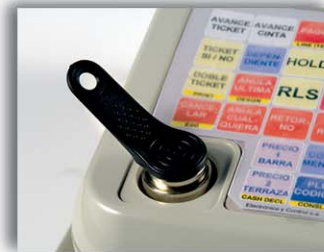
Cerradura Llave Dallas (opcional)