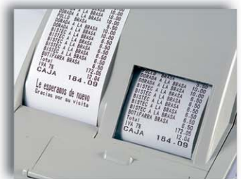
Ticket / Cinta de control